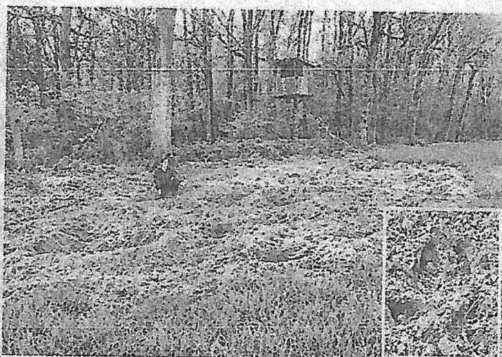
Le bout de parcelle de blé situé au pied du chêne ressemble à un terrain de bi-cross. Des sangliers en quête de glands sont passés par là.